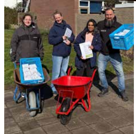
Het team op pad met een leuke verrassing voor de bewoners.